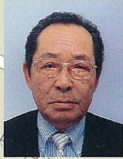
1 上鷲宮・鷲宮 白鷲・若宮

法人会は50年以上の歴史をもち、現在、 全国で100万社もの多くの企業にご加入いただいています。 あなたの会社もぜひ“法人会”のお仲間になりませんか。