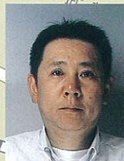
6 中野 4・5・6丁目