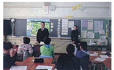
(青年部会による租税教室)