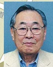
10 中央1・2丁目 本町1・2・3丁目