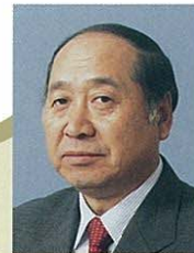
2 江古田・江原町 丸山・沼袋